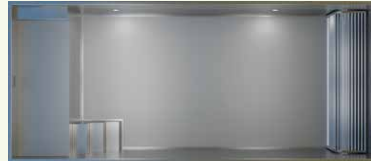
Vue de dessus (représentation non contractuelle)