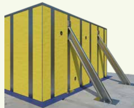
Appui et ancrage (représentation symbolique)