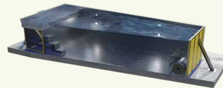
Coupe longitudinale (représentation symbolique)

La coupe longitudinale montre la zone d'eau peu profonde avec l'escalier d'accès ainsi que la banquette tubulaire sous laquelle il est possible de placer une couverture à enroulement (en option seulement, sur certains modèles).